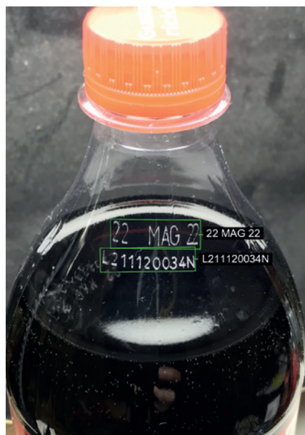
iMAGE S spa, distributore di prodotti per la visione artificiale in ambito industriale dal 1994, è lieta di presentare il nuovo algoritmo di Optical Character Recognition basato su reti neurali profonde incluso nella libreria HALCON.

Da iMAGE S il nuovo algoritmo HALCON DeepOCR che offre la possibilità di lettura di date di scadenza e codici lotto